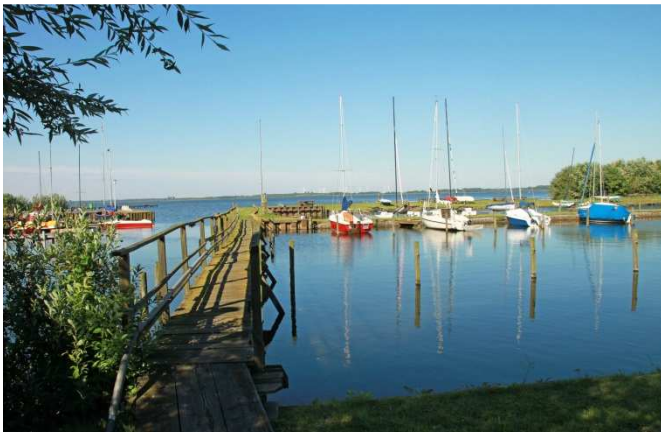
Willkommen im Naturpark Dümmer

Ein ERmutigendes Wochenende, das an aktuelle Bezüge angeknüpft und sie mit dem biblischen Zeugnis verbindet.